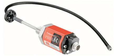
RF 型带圆环磁铁 (磁铁型号：201542)